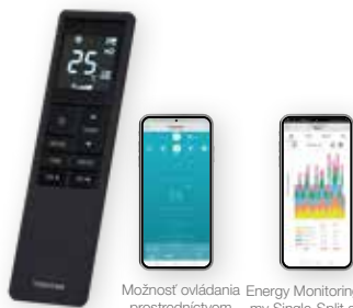
Možnosť ovládania prostredníctvom aplikácie Energy Monitoring pre systémy Single-Split a Multi Next Komfortné infračervené diaľkové ovládanie s podsvieteným displejom a týždenným časovačom