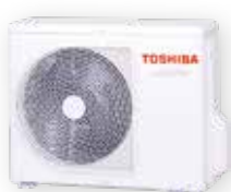
Vonkajšia jednotka (symbolické znázornenie)